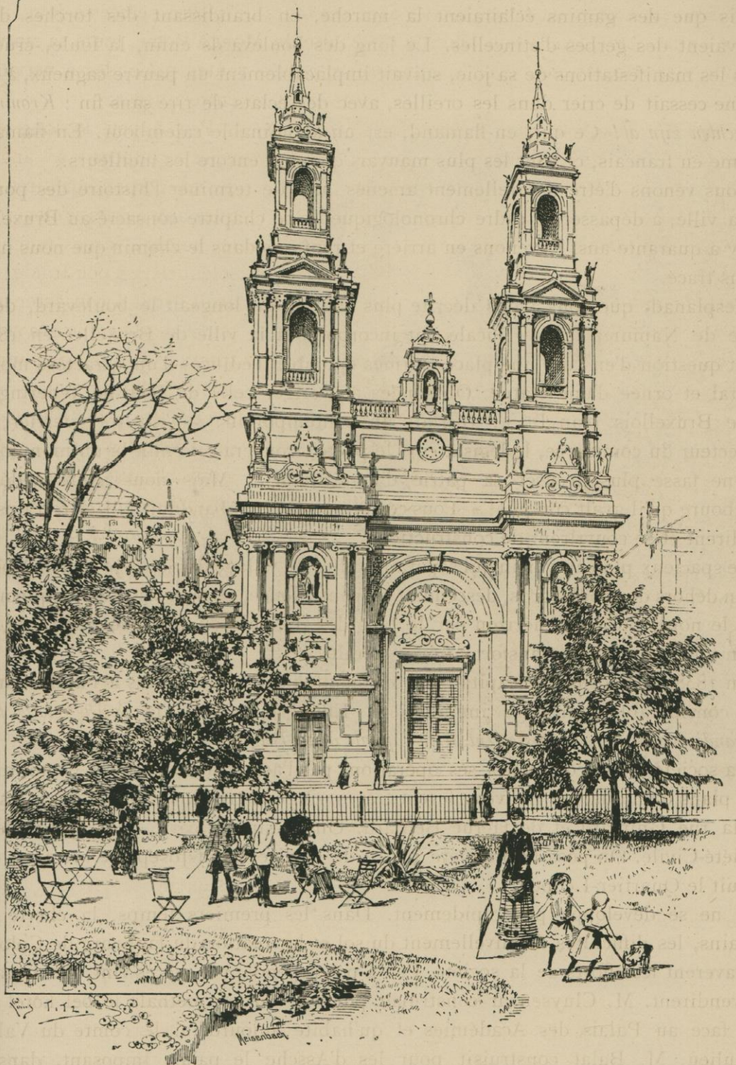
L'ÉGLISE DE SAINT-JOSEPH ET LE SQUARE DE LA SOCIÉTÉ CIVILE.